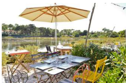
#Bordeaux - Arcachon #Authenticity #GastronomyAdventure

Omdat we overal in Frankrijk actief zijn, kunnen we een compleet pakket aan services bieden wat betreft het organiseren van uw vergaderingen, incentive reizen, seminars, auto-evenementen, recreatieve reizen en individuele reizen.