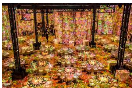
#Paris #ImmersiveExperience

Onze liefde voor Frankrijk kent vijf goede redenen! Want wij zien Frankrijk als - de hemel voor foodies en wijnliefhebbers - een schatkamer vol kunst en cultuur - een magische wereld vol natuur-schoon - het land met de charmantste kustregio's - zeer ervaren en geroutineerd met het ontvangen van gasten.