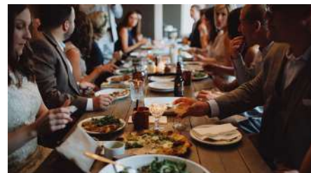
#EatwithLocals #Connection #Memories

Onze reactieve, innovatieve en flexibele teams hebben een duidelijke missie: ervoor zorgen dat u en uw klanten échte ervaringen hebben. En ook dat ze werkelijk in contact komen met Frankrijk en met de Fransen zelf. We zoeken altijd naar sterke en charismatische persoonlijkheden om uw gasten de rijkdommen van dit land echt te laten voelen en zien.